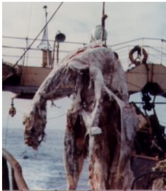
در سال ۱۹۸۲ یک کشتی ماهیگیری این موجود عجیب را صید کرد